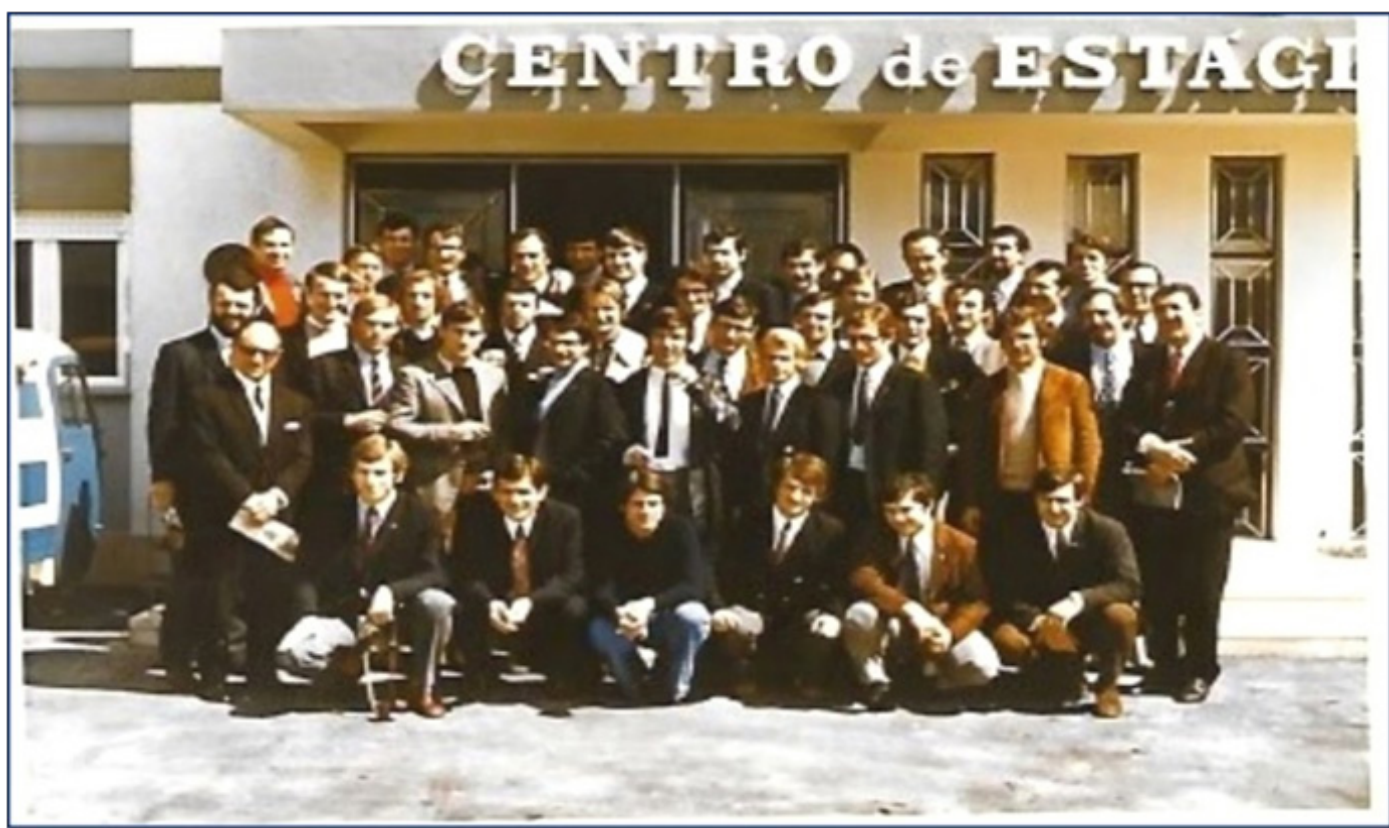
Les bécistes regroupés devant le centre universitaire à Lisbonne.